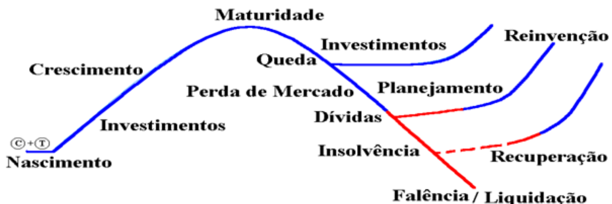
GRAFICO DA VIDA DA EMPRESA

A obtenção de crédito também está relacionada a uma importante preocupação dos micro e pequenos empresários. O Estatuto da Microempresa (Lei n. 9.841/99) estabelece tratamento diferenciado simplificado e facilitado na obtenção de crédito nas Instituições Financeiras Oficiais, assim como o SEBRAE, que através de suas sedes estaduais e site oficial na Internet, viabiliza programas de microcrédito, através de editais.